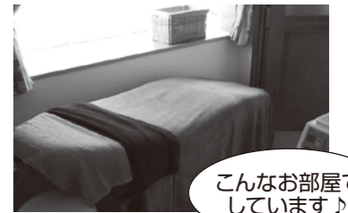
こんなお部屋でしています♪

このコーナーでは、CATでエステを受けていらっしゃる方のお声や、施術者の人からなどを気まぐれにご紹介させていただきますと思っていますので、気が向いたら読んでみてくださいね(笑)